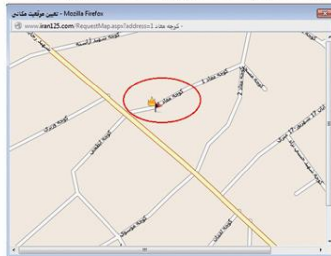
کروکی محل حادثه مطابق شکل بالا توسط ایستگاه قابل مشاهده می باشد

کاوشگر، محل کوچه مورد نظر را روی نقشه به صورت پرچم نمایش می دهد. اپراتور با توجه به اطلاعات دریافتی از شهروند محل دقیق حادثه را با علامت آتش روی نقشه مشخص می کند. کاوشگر، محل کوچه مورد نظر را روی نقشه به صورت پرچم نمایش می دهد. اپراتور با توجه به اطلاعات دریافتی از شهروند محل دقیق حادثه را با علامت آتش روی نقشه مشخص می کند.